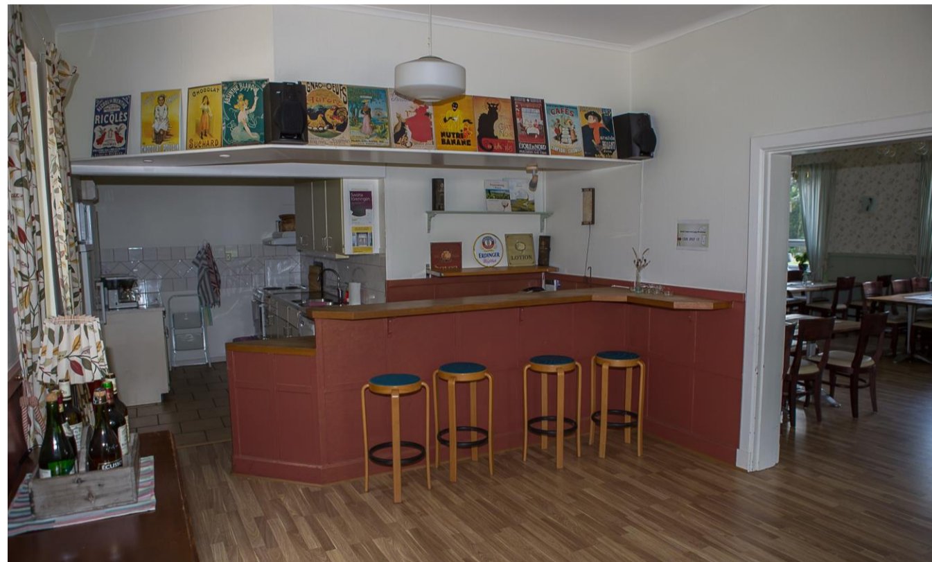
Bar och kök Bottenvåningen

Glas och porslin Ingår. Samt till- gång till kyl/frys