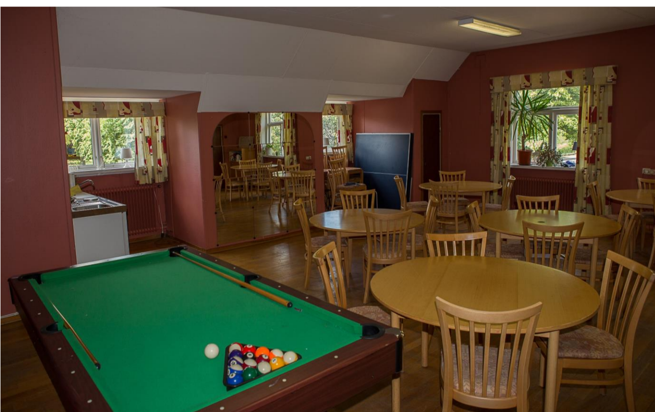
Möteslokal andra våningen

Glas och porslin Ingår. Samt till- gång till kyl/frys