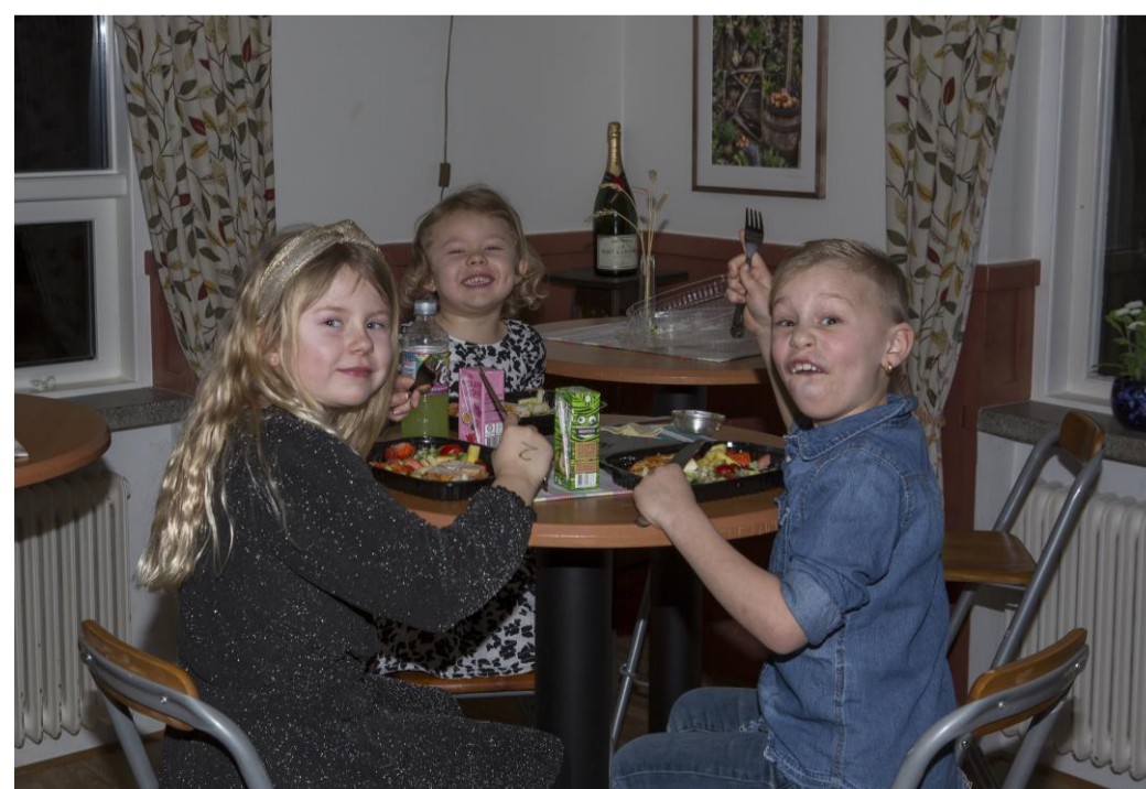
Matbiten efter årsmötet