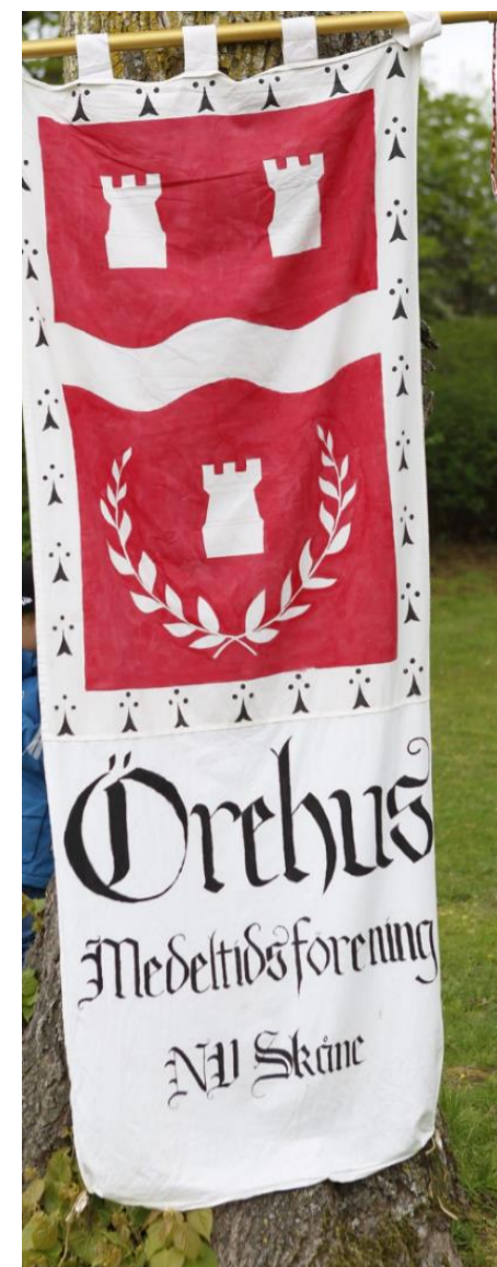
Bilderna är från Ausås Bygdedag 1 maj 2019

Vår målsättning är att lära oss mer om medeltiden, både genom teoretiska studier och praktiskt då vi utövar de medeltida hantverk som vi lärt oss.