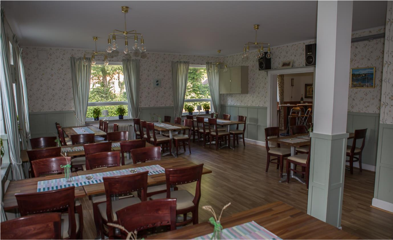
Festlokal bottenvåningen Plats för 45 sittande gäster