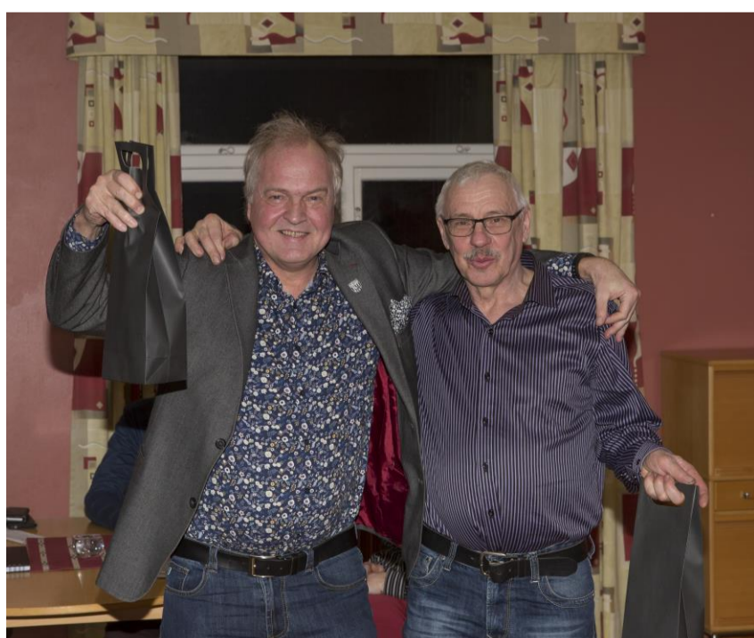
Avtackades för förtjänstfullt arbete