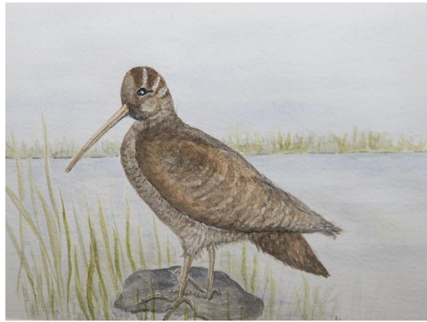
Vette och morkulla av Maija Håkansson