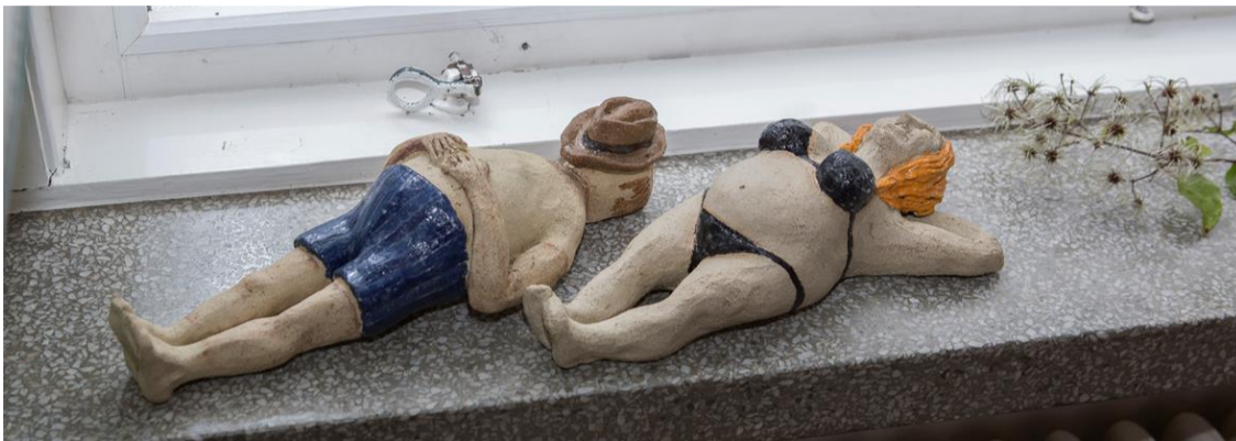
Solbadare? Av Britt Berlin

Sist, men absolut inte minst, grillade scouterna korv.